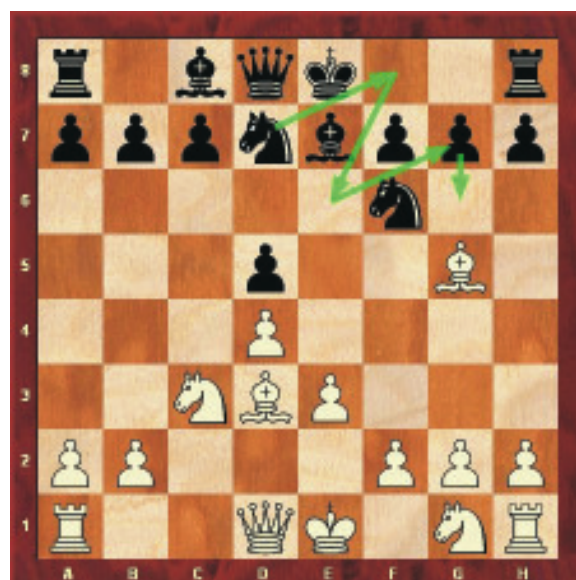
Norbert Räcke (Wiedenbrück) Gunther Stephan 0:1